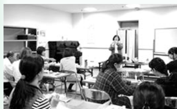
昨年の講座のようす