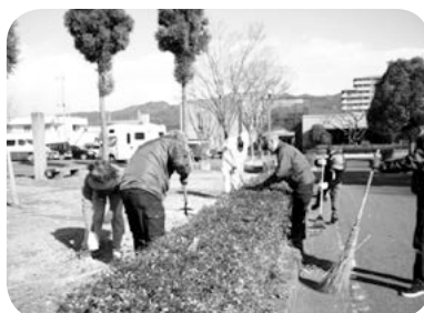
森北公園は綺麗に手入れされて市民の憩いの場に

月2回の活動は仲間との親睦にもなり、楽しい時間です。以前作成した詩集「渡し船」や「わが町そぞろ歩き」の拡大冊子と共に社会福祉センターに置いてありますのでご覧ください。(市広報は図書館にも)