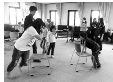
白熱したイス取りゲーム!!!

午後からは、しっぽ取りゲームやイス取りゲームを子どもも大人も一緒に盛り上げて遊びまし