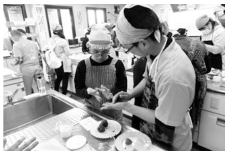
ぼたもち作りに集中…

平成26年度に引き続き、今年も竜王アグリパークに行きました! 3月29・30日の2日間開催し、計22名の子どもたちの参加がありました。午前中は、動物のエサやりを楽しみ、グラウンドゴルフをする子どもたちは、時間を忘れるくらい熱中してやりました。